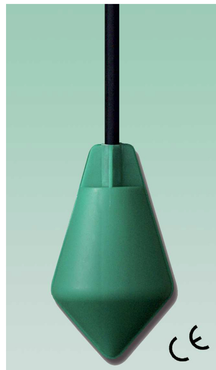
VR - ECO

SOBA SMALL - URZĄDZENIE PODOBNE DO TYPU SOBA, JEDNAK MNIEJSZE, ODPOWIEDNIE DO NIEDUŻYCH ZBIORNIKÓW I PREFABRYKOWANYCH PRZEPOMPOWNI. PRZY ATRAKCYJNIEJSZEJ, NIŻSZEJ CENIE POSIADA TĘ SAMĄ CHARAKTERYSTYKĘ ELEKTR. CO SOBA.